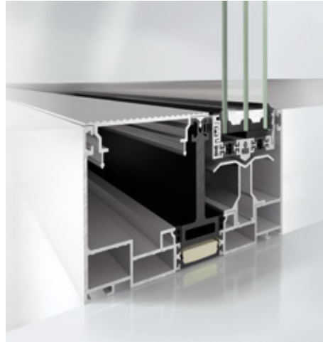
Cerceva ascunsă pentru toc de 90 mm Lowered vent profile in the 90 mm outer frame