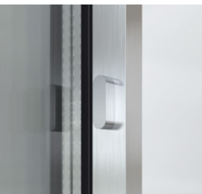
Sistem de încuiere montat central Locking system mounted centrally

The Schüco ASE 67 PD aluminium sliding system also includes a locking system that is fully integrated in the vent and available in three different versions: as a locking point integrated in the interlock section, with or without a lock, or as a 3-point lock for the outer frame that is inserted in the side of the vent. Its combination furthermore provides a high-quality, burglar resistant unit, ensuring maximum security and the greatest possible protection.