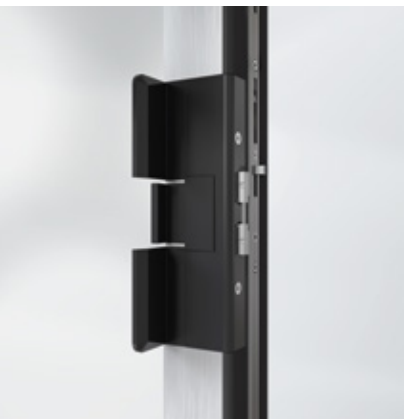
Sistem de încuiere integrat lateral Locking system integrated at the side

Both the narrow profiles and the insertion of the vent profile in the outer frame increase the proportion of window area. This allows more natural light into the room, which not only contributes to improving the physical and mental wellbeing of the user, it also saves energy in the long term.