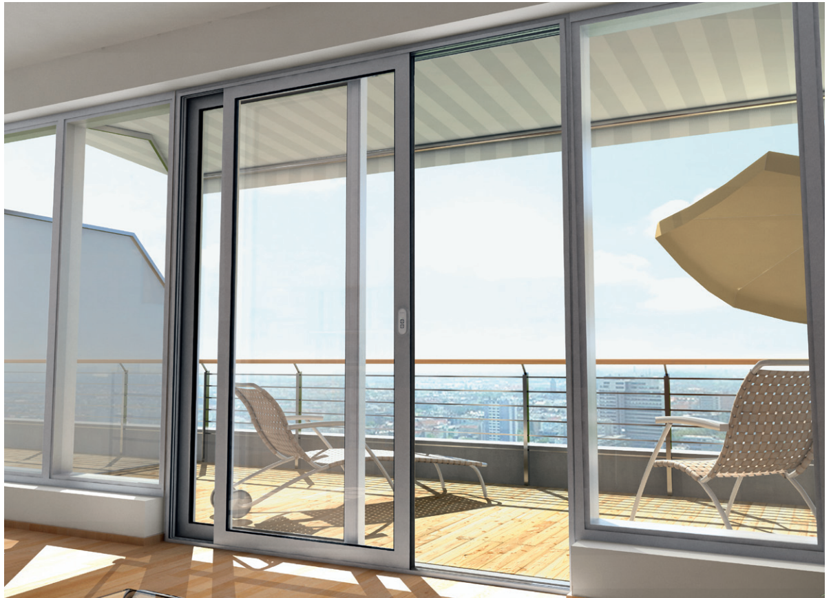
Schüco e-slide sistem de acționare ascuns concealed drive system

Operabil prin apăsare pe buton: cu cât ușile glisante prin ridicare se pot acționa mai ușor, cu atât este mai mare confortul utilizatorului. De aceea Schüco a dezvoltat tehnologia e-slide. Cu ea pot fi mișcate complet automatizat, silențios și rapid, cercevele până la 250 kg.