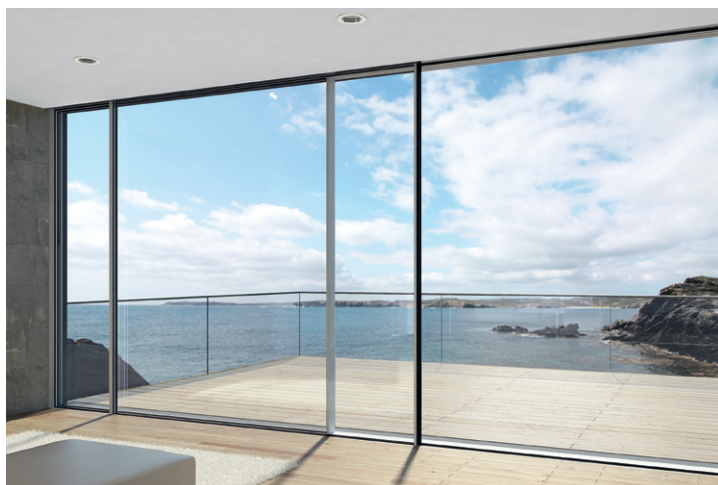
Sisteme glisante Sliding systems

Schüco sliding systems fulfill a whole range of demands from investors and private clients alike. In terms of energy saving, security, operating comfort and design, they offer individual solutions of the highest standard.