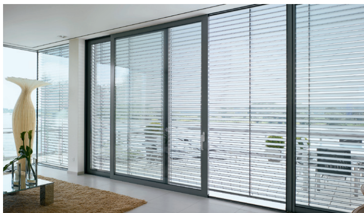
Design interior transparent Transparent interior design