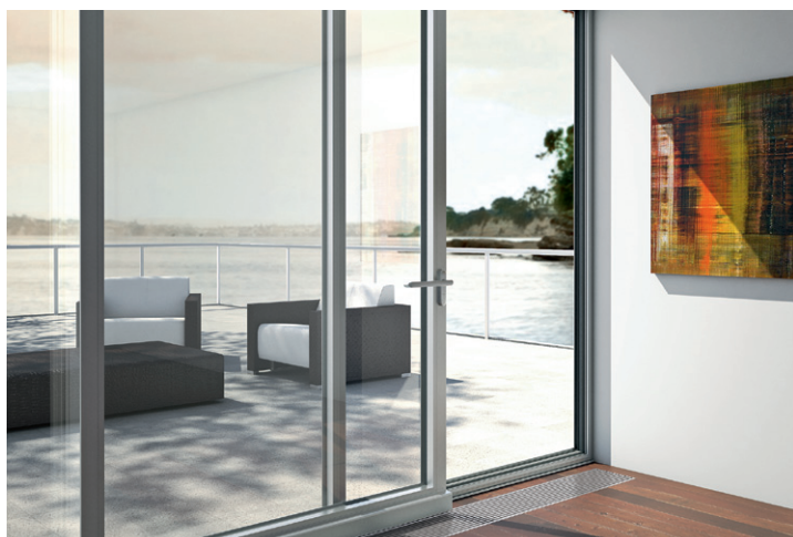
Sisteme oscilo-culisante Tilt/slide system