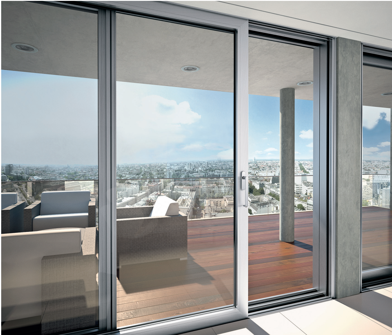
Schüco ASS 70.HI sistem glisant cu ridicare cu izolație termică superioară high insulation lift-and-slide system

O ușă glisantă cu ridicare din profile de aluminiu de la Schüco alunecă foarte ușor. În poziția închis este perfect etanșă la intemperii și asigură cea mai bună izolare termică și fonică. Construcții cu până la trei șine de rulare fac posibile deschideri cu lățimi mari și oferă flexibilitate pentru utilizare în construcții vitrate cu suprafețe mari.