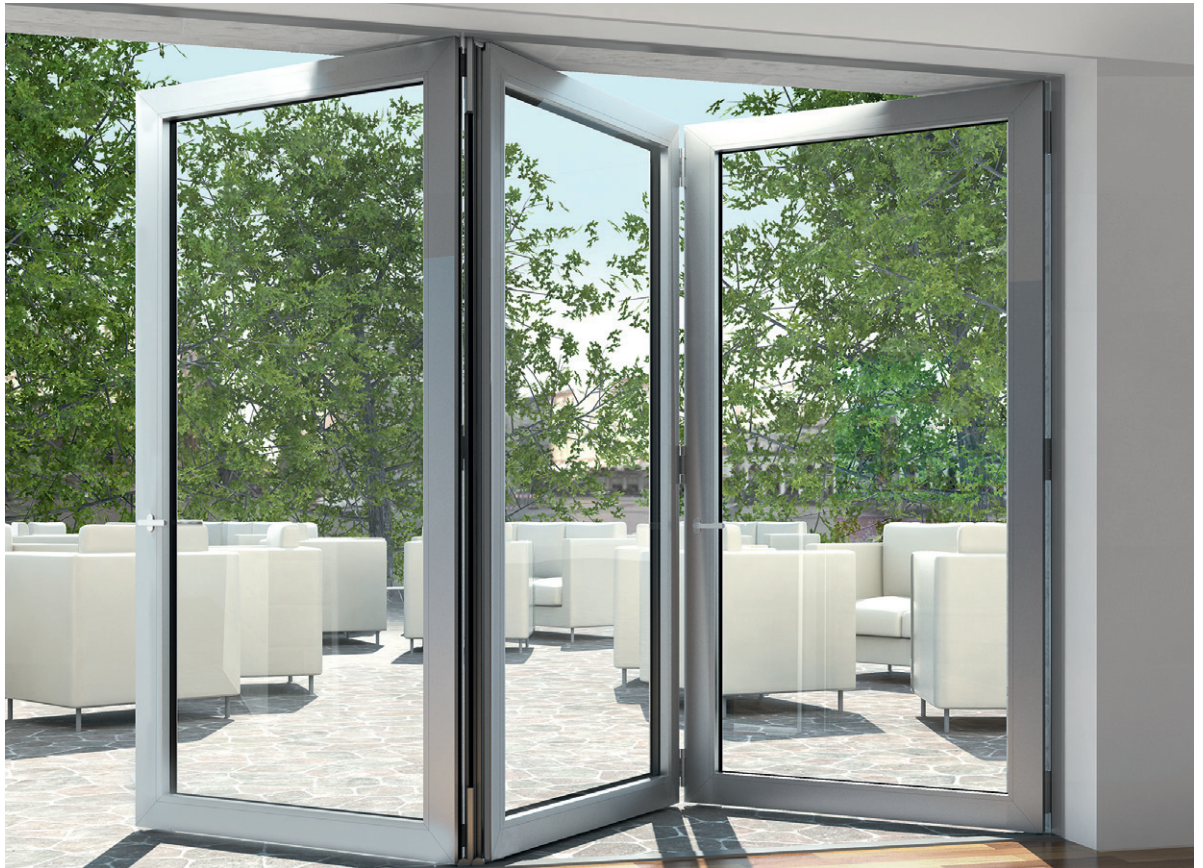
Schüco ASS 70 FD sistem pliant izolat thermically insulated folding sliding system

Sistemele pliante Schüco oferă avantajele unei game diverse de variante constructive, acționare silențioasă, etanșeitate și transparență când sunt închise. În funcție de domeniul de utilizare sunt disponibile două variante: