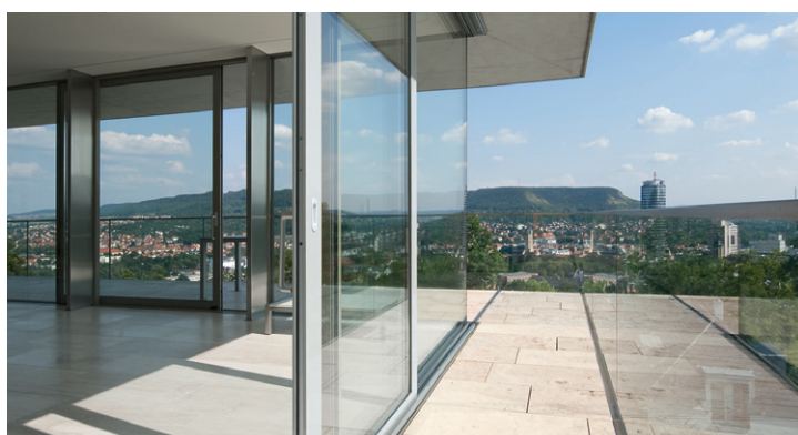
Arhitectură scăldată în lumină Architecture flooded with light