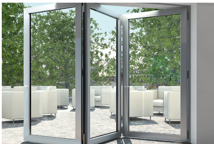
Sisteme pliante Folding sliding systems