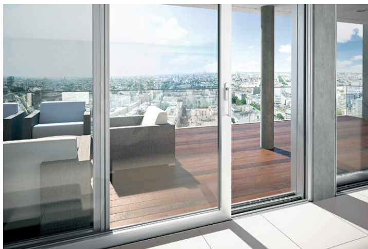
Sisteme glisante cu ridicare Lift-and-slide systems